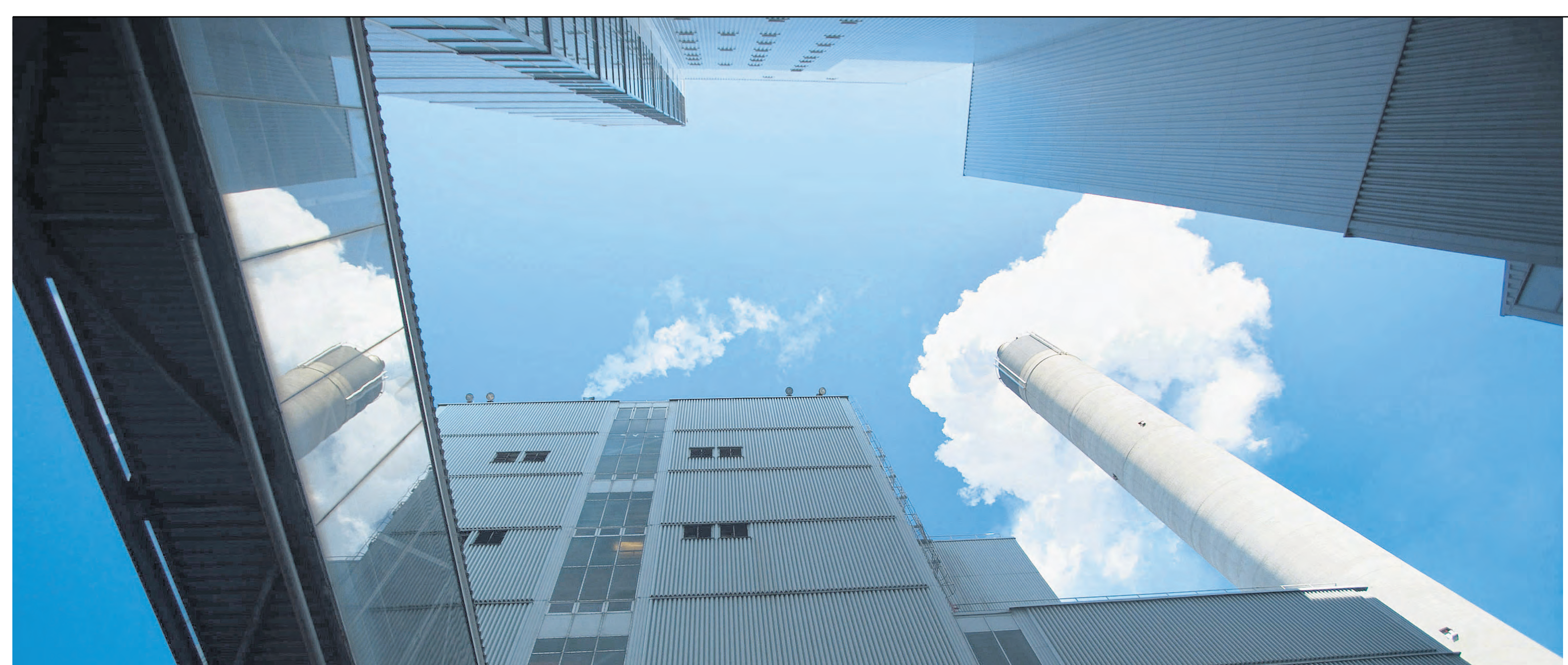
Schoorsteen van de Finse papierfabriek Stora Enso OYJ in Imatra (Oost-Finland)